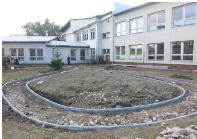
ZŠ v okrese Púchov